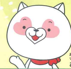
あいネットグループ マスコットキャラクター あいネッコ

仕事もプライベートも充実し、イキイキと日々を過ごすことが、 幸福な人生につながる。そんな思いから生まれた、あいネットグループの 特徴的な福利厚生・制度をピックアップしてご紹介。