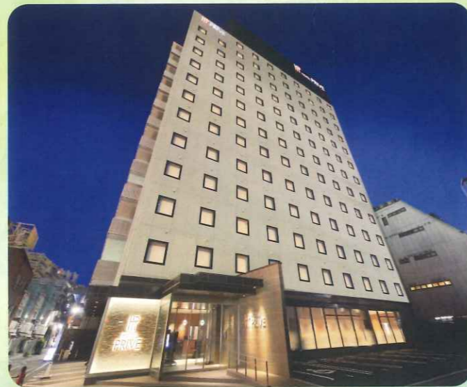
ホテルプリヴェ静岡【口コミ評価 駅近 No.1】 静岡駅南口から徒歩1分。 駅近唯一の最上階スカイSPAを完備したシティホテルです。