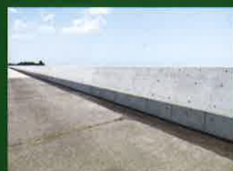
海岸高潮対策工事