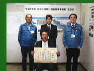
国土交通省・三重県から、感謝状や表彰を頂いております。