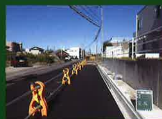
雨水幹線築造工事